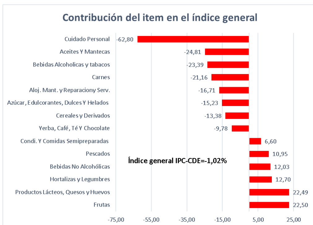
Figura 2 – Contribución porcentual del ítem en el índice general

La figura 2 reporta la contribución de cada subgrupo en el índice general IPC-CDE. Como se puede observar en la figura, los productos del subgrupo cuidado personal, así como también los productos del subgrupo productos aceites y mantecas fueron los ítems que más contribuyeron para la disminución del índice general de precios.